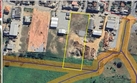
Imagem 02 - Identificação dos cursos d'água