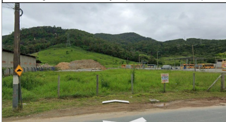
Imagem 04 - Foto do local (Google Earth, 11/2023)