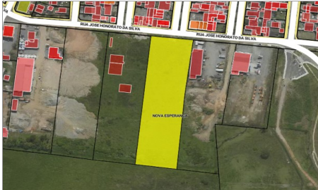
Imagem 01 - Localização (Geoprocessamento)

Zoneamento: ZACC IV - Zona de Ambiente Construído de Densidade Controlada (habitacional)